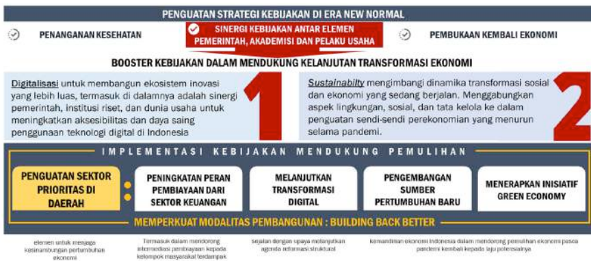
Gambar 3. Skema Kebijakan Pendukung Utama ( Booster )

Sementara itu, pendekatan di sisi sustainability berusaha mengimbangi dinamika transformasi sosial dan ekonomi yang sedang berjalan, dengan targetnya bahwa masyarakat Indonesia mampu sejahtera tanpa lebih banyak mengorbankan alokasi sumber daya ekonomi bagi generasi