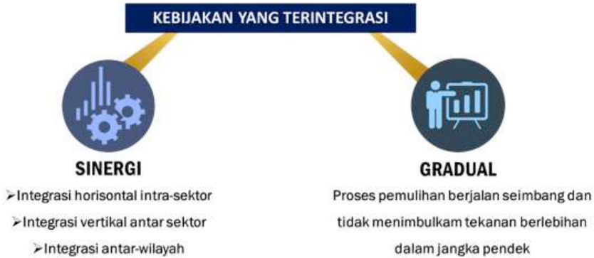
Gambar 4. Model Sinergi Kebijakan Terintegrasi

mendatang. Kaitannya dengan kebijakan pemulihan, adalah bagaimana menggabungkan aspek kepedulian terhadap lingkungan, sosial, dan tata kelola di dalam penguatan sendi-sendi perekonomian yang menurun selama pandemi.