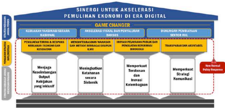
Gambar 2. Pilar Strategi Penguatan Pemulihan Ekonomi di Era Digital

yang dilaksanakan pemerintah, terdiri dari 3 (tiga) fokus yang disebut sebagai ‘game changer’ dalam menanggulangi dampak lebih lanjut dari Pandemi Covid-19, yakni (i) intervensi kebijakan kesehatan melalui peningkatan program vaksinasi secara nasional, (ii) akselerasi fiskal terutama untuk perluasan bantuan perlindungan sosial, dan (iii) dukungan pembiayaan kepada sektor riil sebagai variabel yang determinan dalam membangun resiliensi pemulihan.